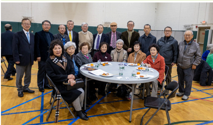
3월 15일 언더우드 연주회에 참석한 골든클럽 회원