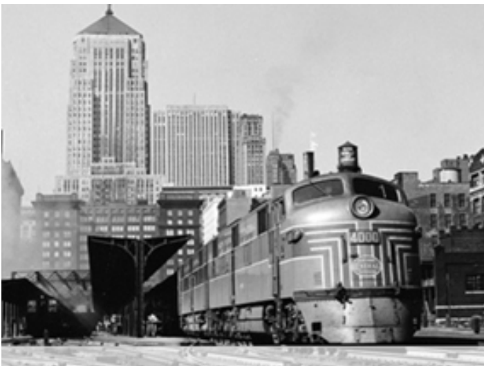
New York Central Railroad

그의 아들 William Henry Vanderbilt 는 남북전쟁 후 산업(북부)과 남부농업(남부)을 연결하는 철도·공장·물류의 중요성 폭발하게 되고 미국이 산업 중심 국가로 전환하게 되었을 때 전국 철도망 구축하여 미국을 하나의 시장으로 묶는데 중요 역할을 담당하여