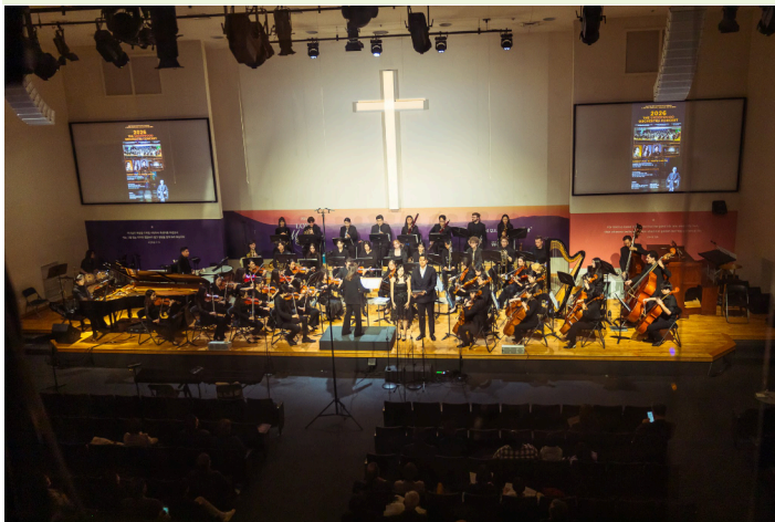
3월 15일 2026 Underwood Orchestra Concert