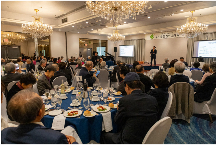
3월 7일 골든클럽 2026년 신년교례