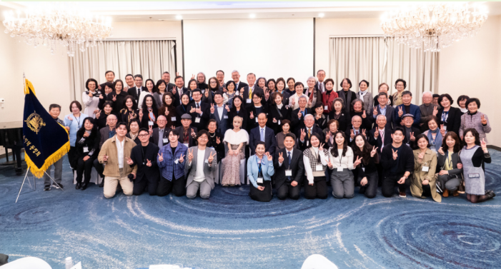
3월 23일 서울대가 자랑하는 성악가 조수미 환영만찬